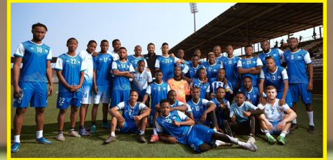
التجربة أثارت سخط أنصار