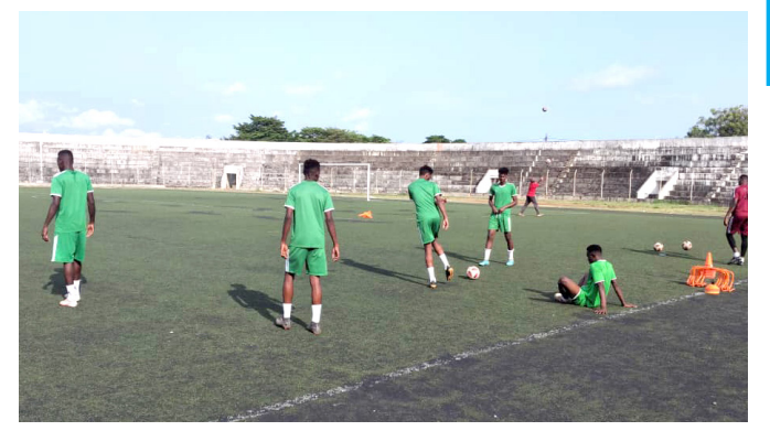
في الحصة التدريبية الثانية لأولمبينا بكونتو