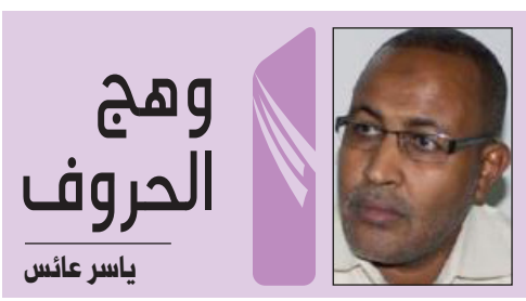
وزير ورئيس ومدير!!

الوزير تدخل لإعادة الأمل ، وخاطب رئيس النادي الذي رفض في تصريحات رسمية الإستسلام والإعتراف بأن الشباب بات على أبواب الخروج. تدخل (الوزير) ومخاطبته (الرئيس) تحولت