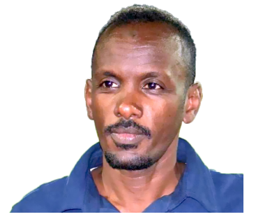
إعداد / يس علي يس

نشف ريق الغناوي سكات.. وكت شافك مستقة ظن.. ولمن خطوتك رجعت.. رجع فاضى الفؤاد ممتن.. بلاها أنا كم بنيت امان.. وكم شيدت فيني وطن.. زرعتو من الأمانى حنين.. سقيتو أنا من دمايا زمن.. تكيت في طلتو الاحزان..